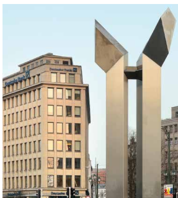
13-17 Marnixlaan 1000 Bruxelles – Belgique