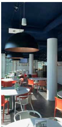
41-63 Neptunstraat Hoofddorp – Pays Bas